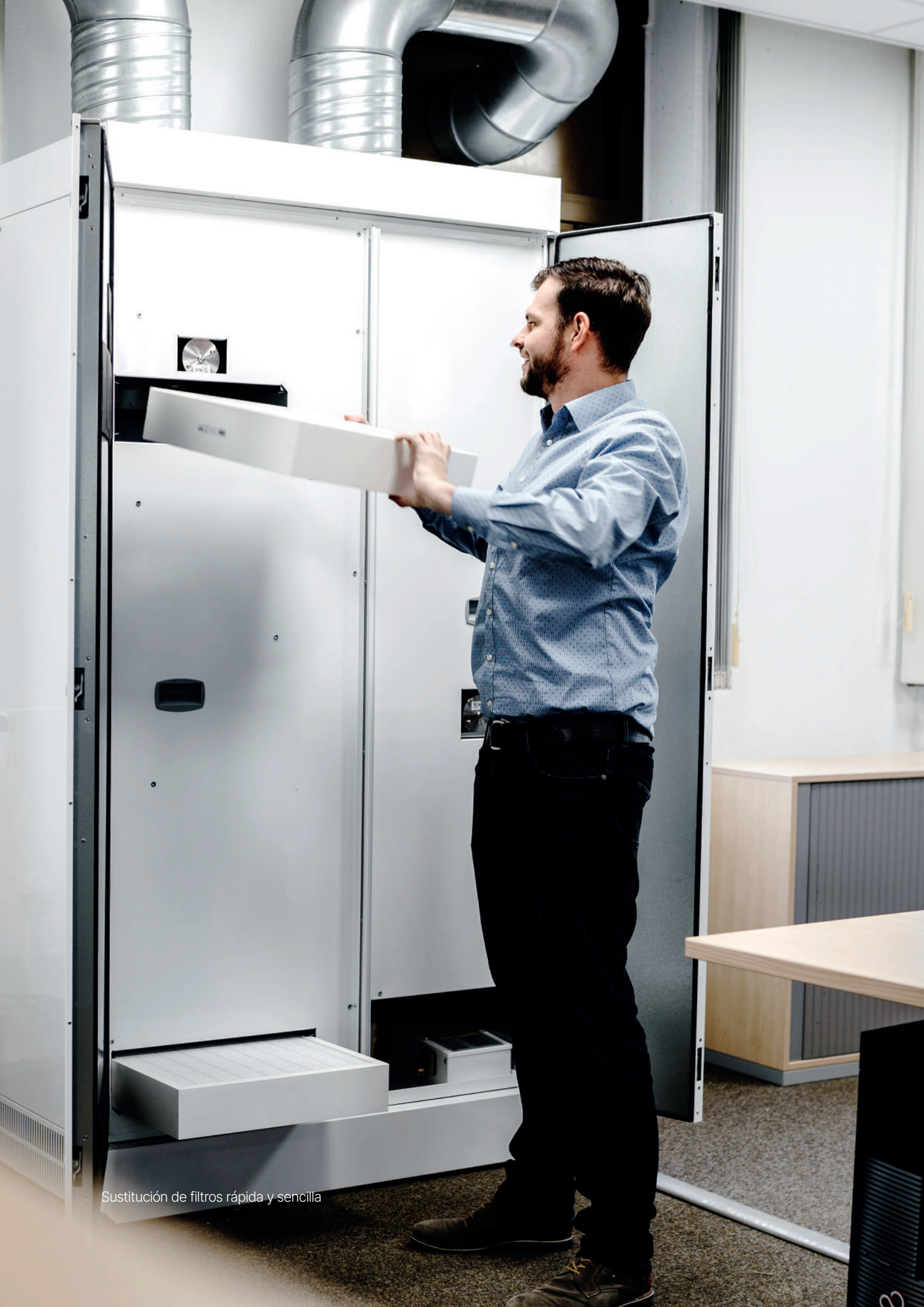
Sustitución de filtros rápida y sencilla