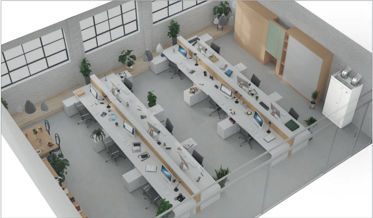
Ejemplo de equipo de climatización descentralizado de suelo