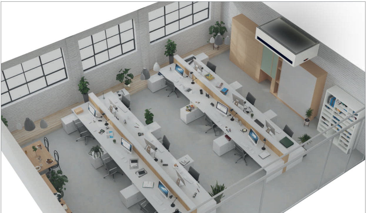
Ejemplo de equipo de climatización descentralizado de techo